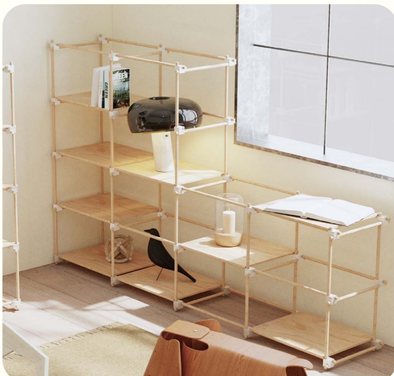
Modulair kaststelsel 'Frame'