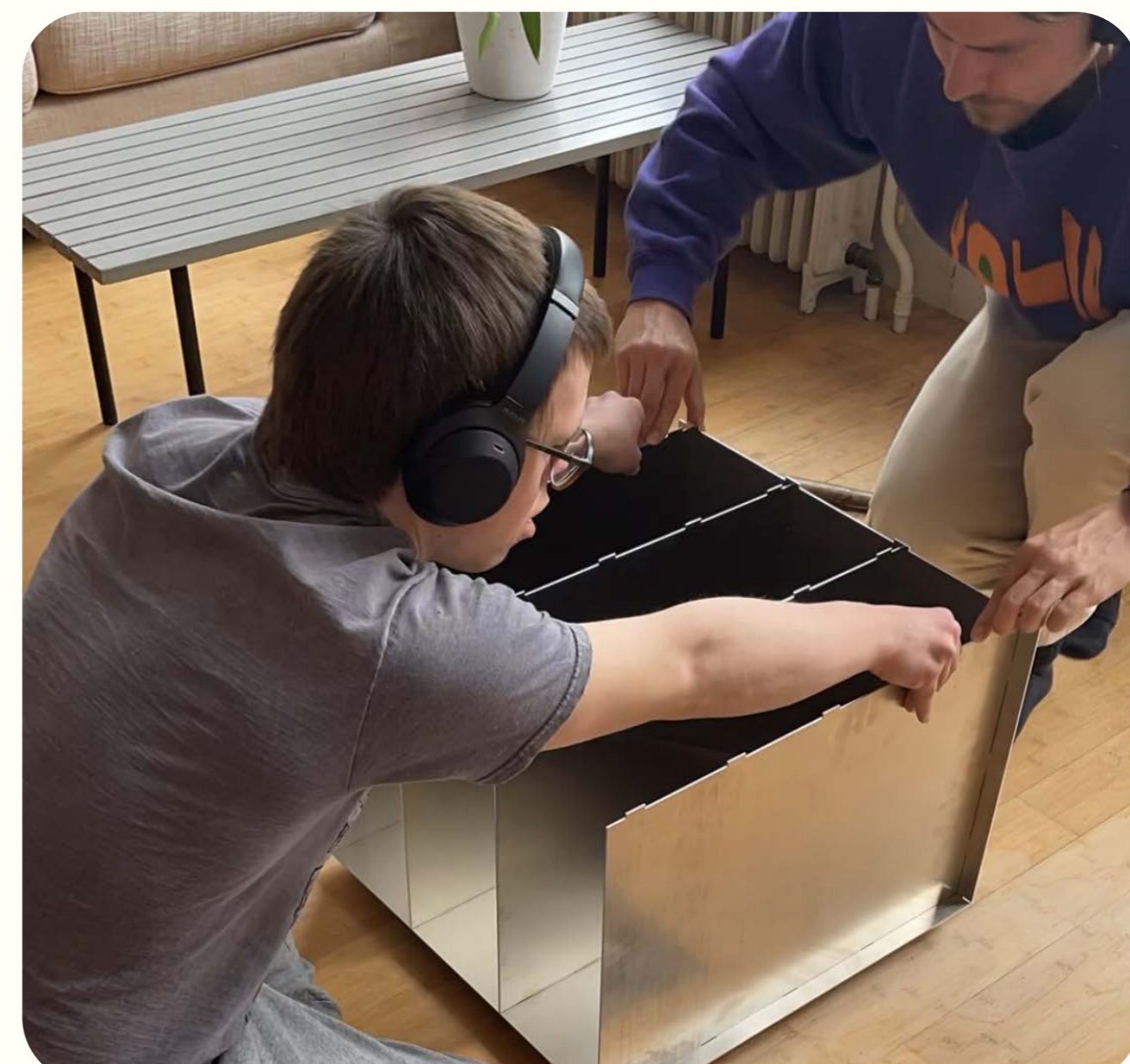
Samenwerken om een kast voor A3 kunstwerken/tekeningen te bouwen.