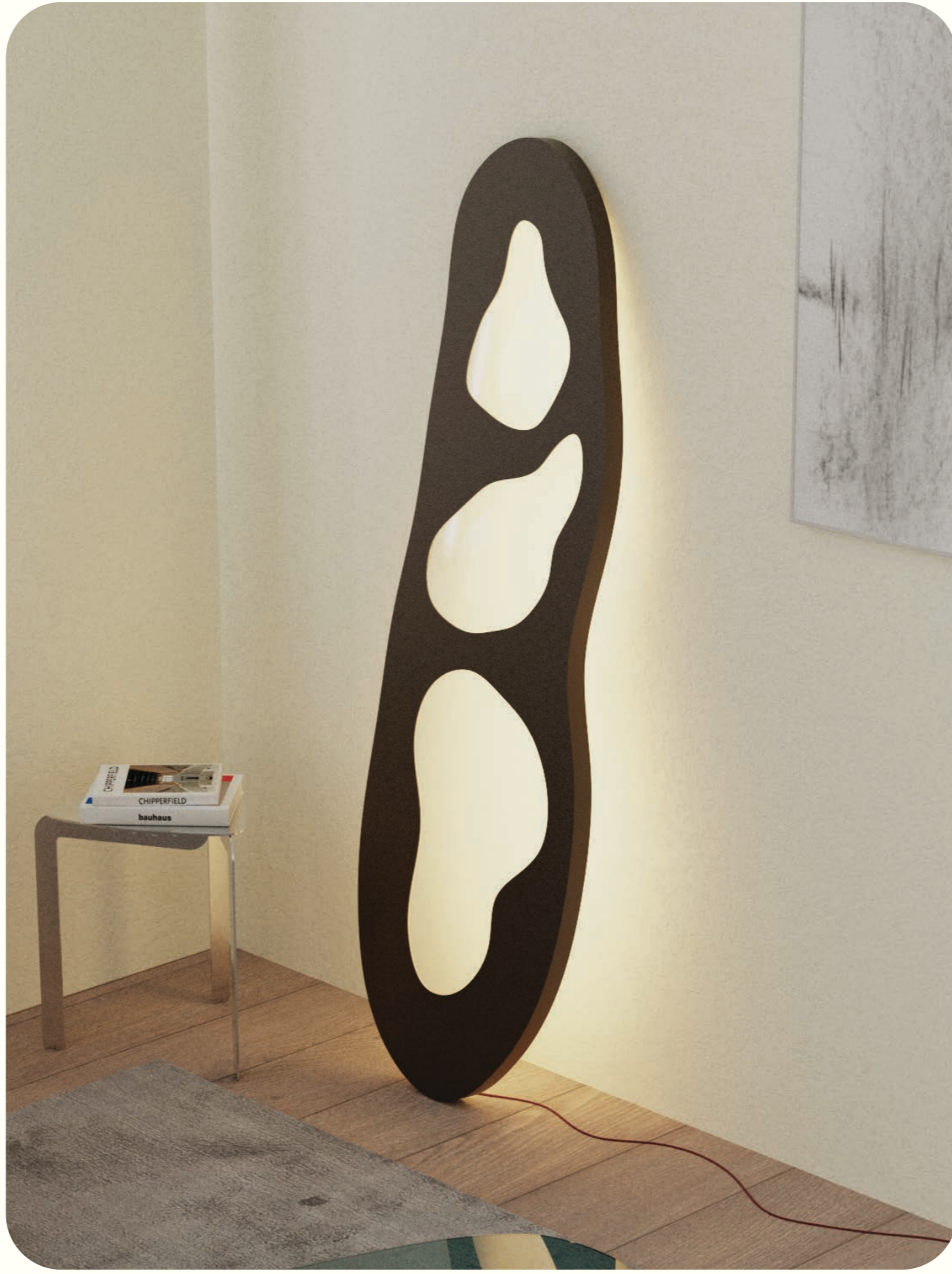
Tweede Kleurtest voor 'Monolight'