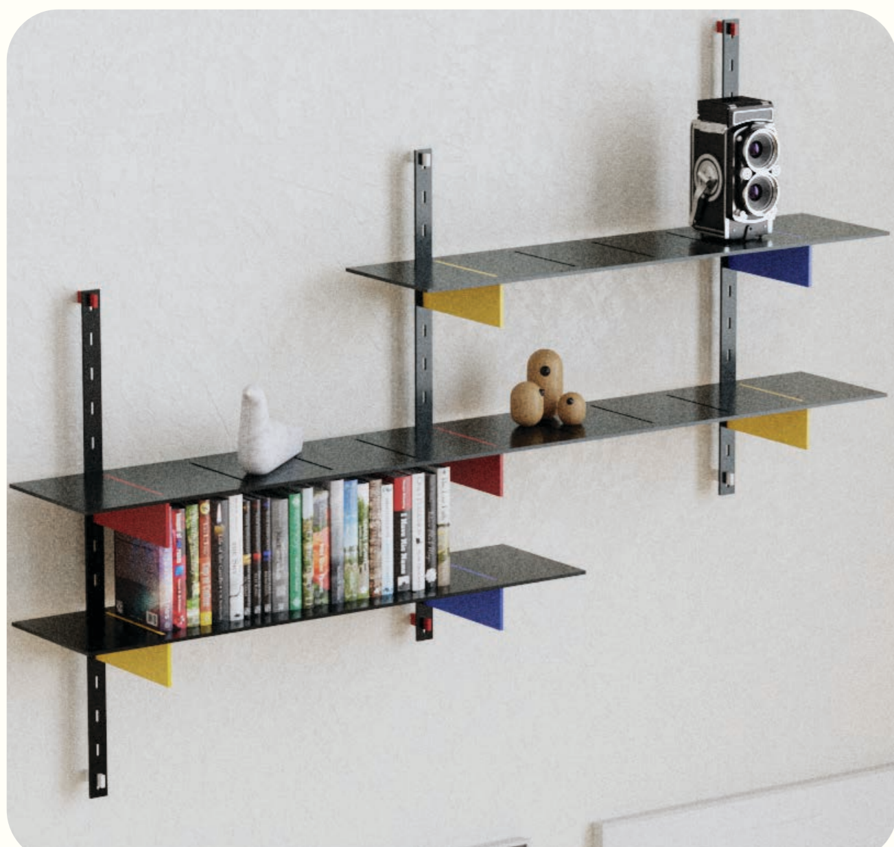
Modulair plankstelsel 'De Stijl', geïnspireerd door een museumbezoek.

Dit project heeft twee doelgroepen. Als werkgever richten wij ons op verstandelijk gehandicapten en sociaal betrokken makers. De samenwerking die daaruit voortvloeit moet tot mooie, duurzame producten leiden. De doelgroep voor de producten zelf is zeer breed, Rotterdamse bedrijven en Rotterdammers die op zoek zijn naar een sociaal gemotiveerd alternatief voor design meubels.