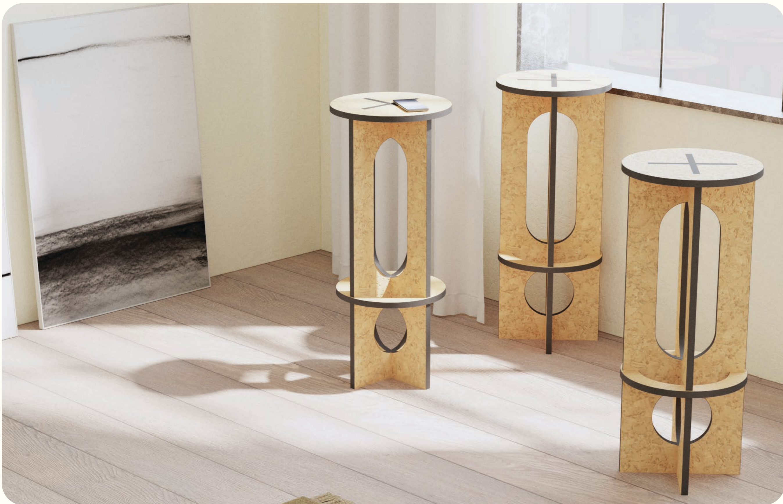
Schets voor een flatpack barkruk die in en uit elkaar gehaald kan worden wanneer nodig. Fysieke test 1:1 versie zijn we nu aan het bouwen.