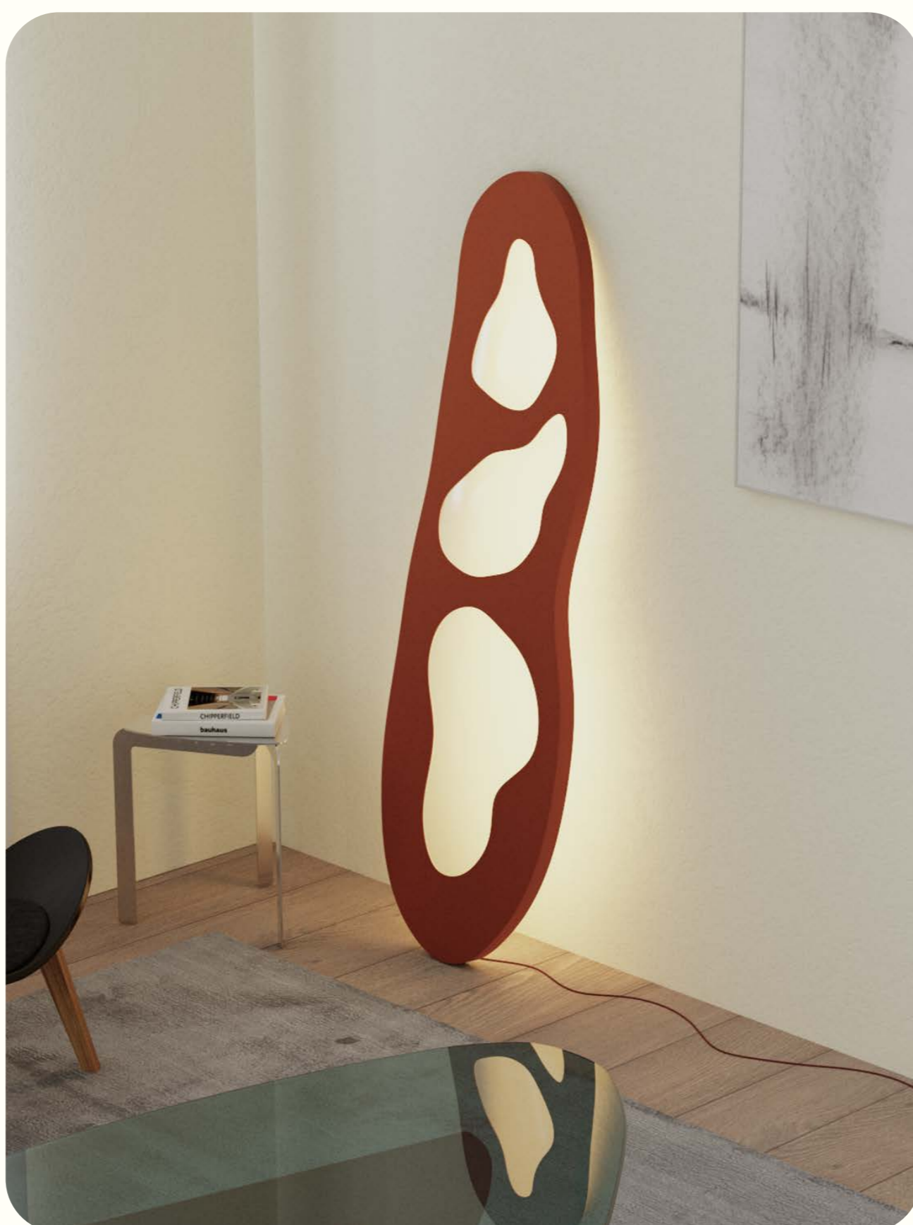
Schetsontwerp voor 'Monolight' als gevolg van de linker sessie.