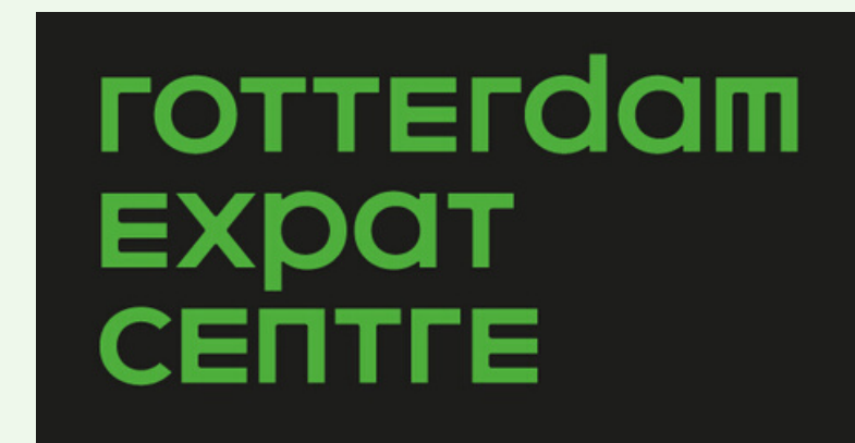
Rotterdam Expat Center