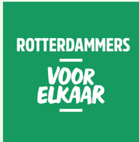
Rotterdammers voor elkaar