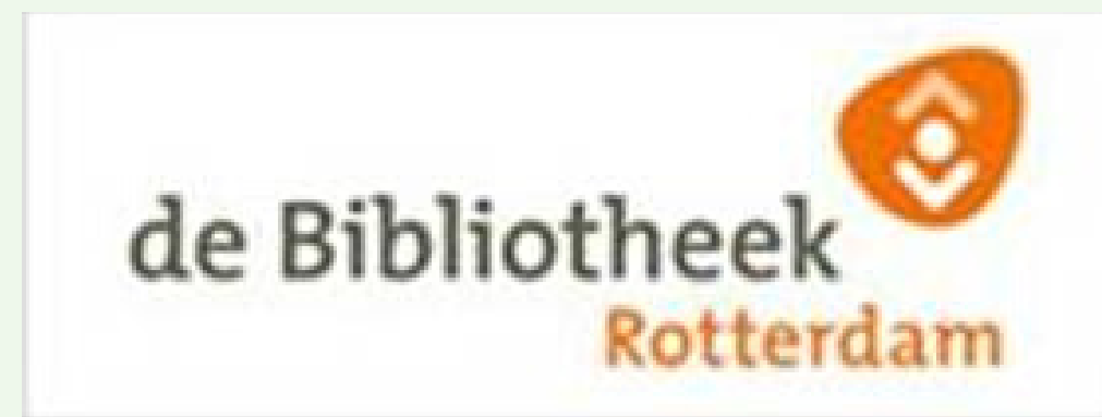
Taal Cafe Blaak